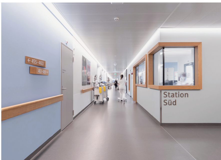
Blau weist den Weg: Im Neubau der UAFP dienen Farbtöne der Orientierung.

ergab sich auch die Zusammenarbeit für das evidenzbasierte Farbkonzept in der UAFP.