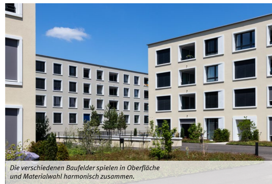
Die verschiedenen Baufelder spielen in Oberfläche und Materialwahl harmonisch zusammen.

* Dieser Text basiert auf einer Publikation aus dem Jahr 2018 und wurde am 24.09.2025 redaktionell angepasst: Die Garantie bezieht sich ausschliesslich auf das Material, nicht auf die Ausführung.