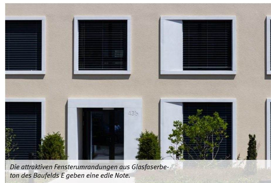
Die attraktiven Fensterumrandungen aus Glasfaserbeton des Baufelds E geben eine edle Note.