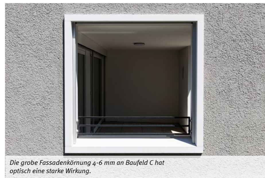
Die grobe Fassadenkörnung 4-6 mm an Baufeld C hat optisch eine starke Wirkung.